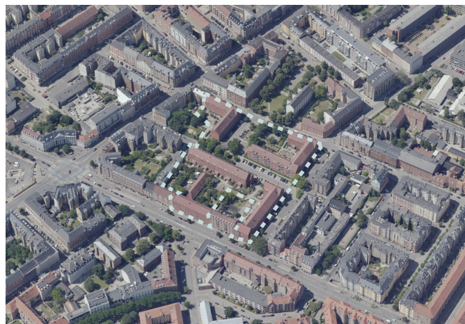
Luftfoto af Runddelen I + II.