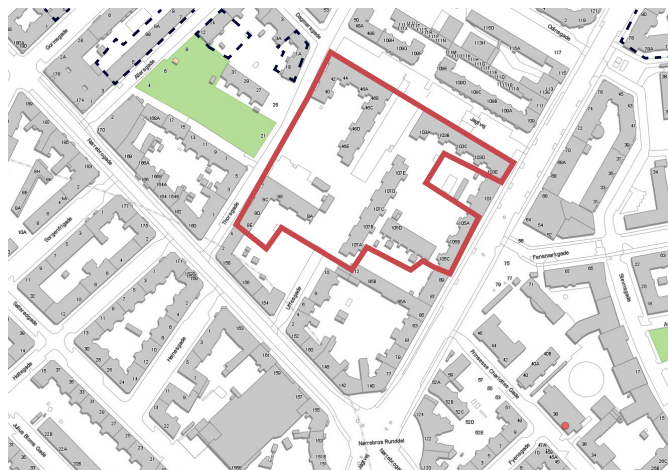
Kortudsnit, hvor Runddelen I + II er markeret med rød farve. Øvrige almene bebyggelser i området er markeret med stiplede linjer.